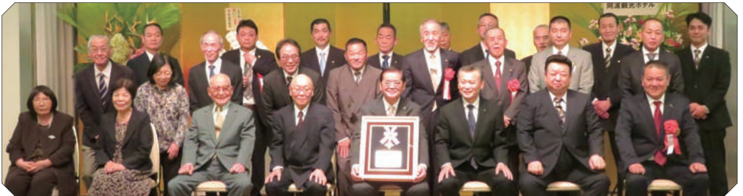
徳島県調理師共栄会 役員の皆様と参会された皆様