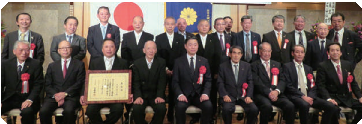
全日本調理師協会 愛知県本部 愛知三味会 役員の皆様と参会された皆様